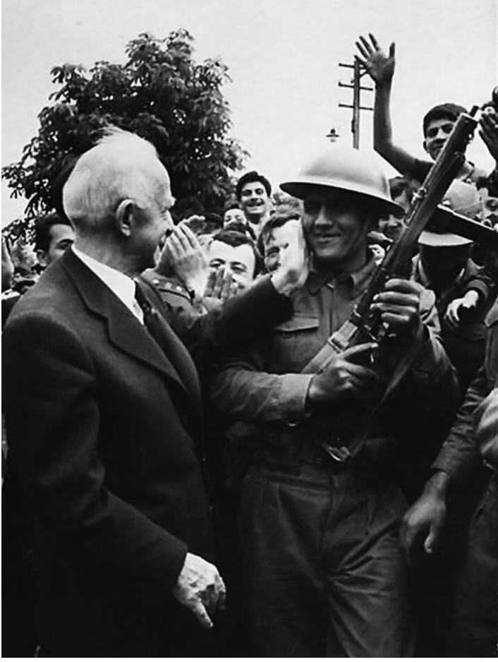
27 Mayıs sonrasında İsmet İnönü 7

Toker, pencereden dışarı bakınca da hem kendi evinin hem de hemen yanındaki evde oturan İsmet İnönü'nün evinin "süngülü tüfek taşıyan askerler tarafından kordon altına alınmış olduğunu görmüş"tü. Sokaklarında bir general ve bir de yarbay vardı. 8 Kapıdan dışarı adımını atar atmaz bir Harbiyeli durdurmuşsa da onu tanıyınca yol vermişti. Sokakta gördüğü tuğgeneral ise İsmet İnönü'nün