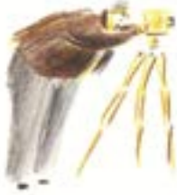
FRANK HURLEY Fotoğrafçı