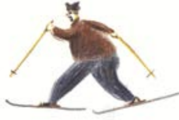
THOMAS ORDE-LEES Motor Uzmanı ve Depo Sorumlusu