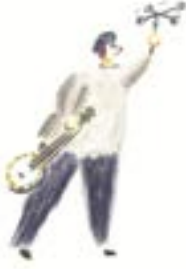
LEONARD HUSSEY Meteoroloji Uzmanı