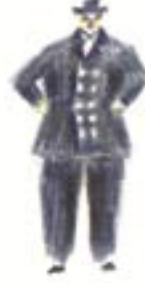
ERNEST SHACKLETON Sefer Lideri